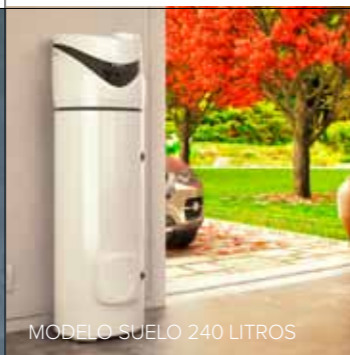
MODELO SUELO 240 LITROS