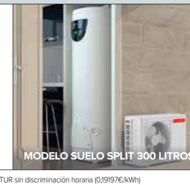
MODELO SUELO SPLIT 300 LITROS