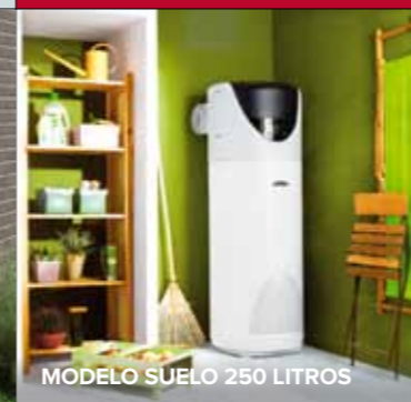
MODELO SUELO 250 LITROS