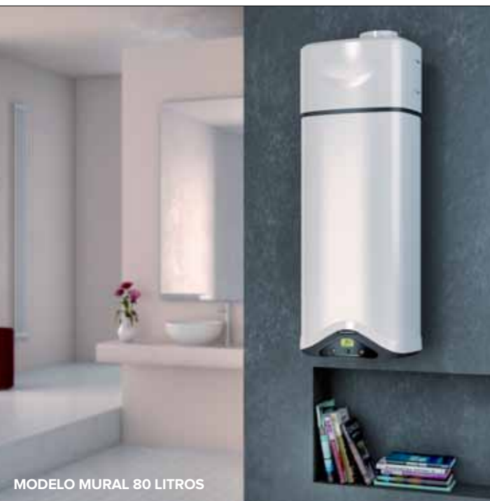
MODELO MURAL 80 LITROS